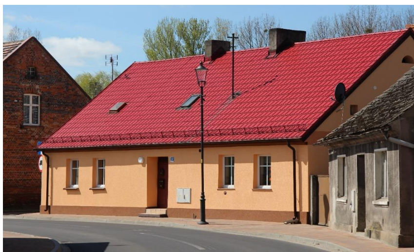
Budynek komunalny w Osiecznej

Zgodnie w ww. uchwałą gospodarowanie mieszkaniowym zasobem gminy należy do burmistrza po zasięgnięciu opinii komisji. Z chwilą uzyskania przez gminę wolnego lokalu do wynajęcia wnioski osób wpisanych na listę osób oczekujących podlegają weryfikacji przez Miejsko-Gminny Ośrodek Pomocy Społecznej w Osiecznej w zakresie warunków zamieszkiwania i warunków materialnych. Wykaz osób zakwalifikowanych do zawarcia umów najmu zatwierdza Burmistrz po uzyskaniu opinii komisji Mieszkaniowej. Członkami komisji są osoby wchodzące w skład Rady Miejskiej. Wykaz podlega podaniu do publicznej wiadomości poprzez wywieszenie na okres 14 dni na tablicy ogłoszeń w siedzibie Urzędu Gminy Osieczna oraz umieszczenie w BIP.