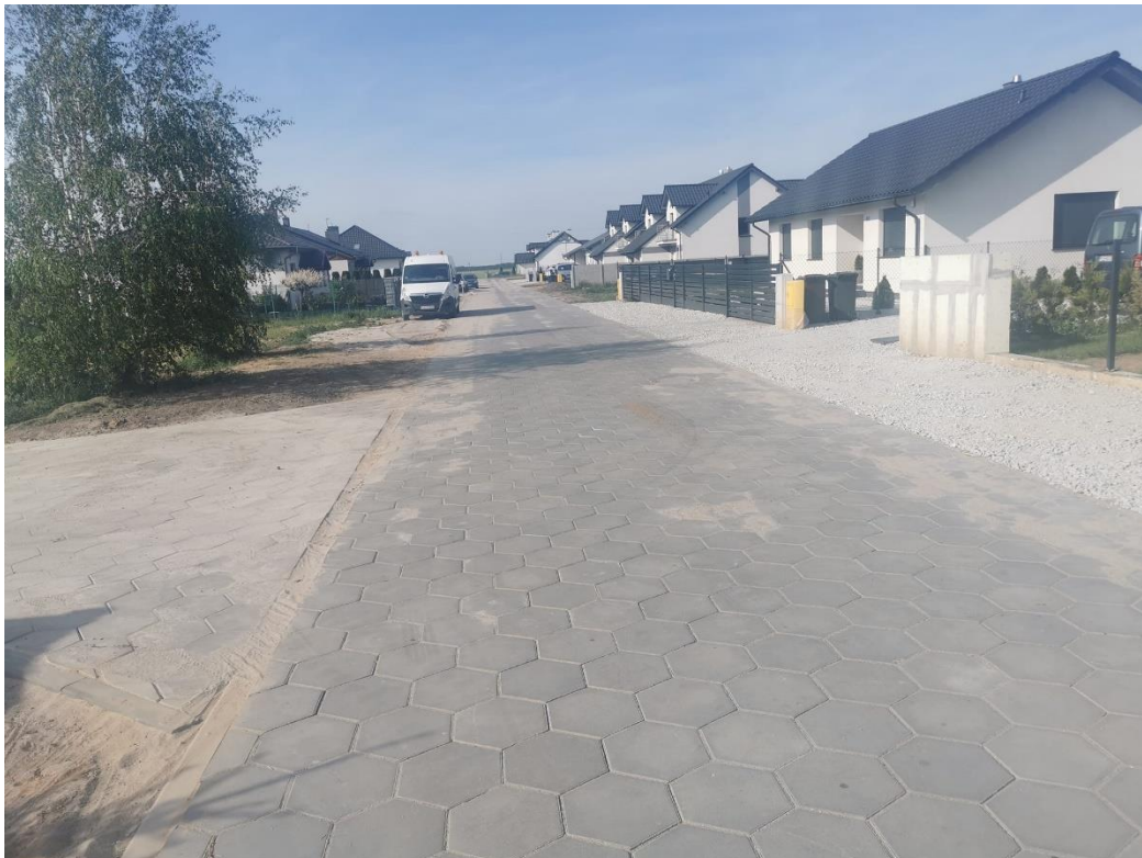
Przebudowa ulic Czereśniowej i Wiśniowej w Kąkolewie