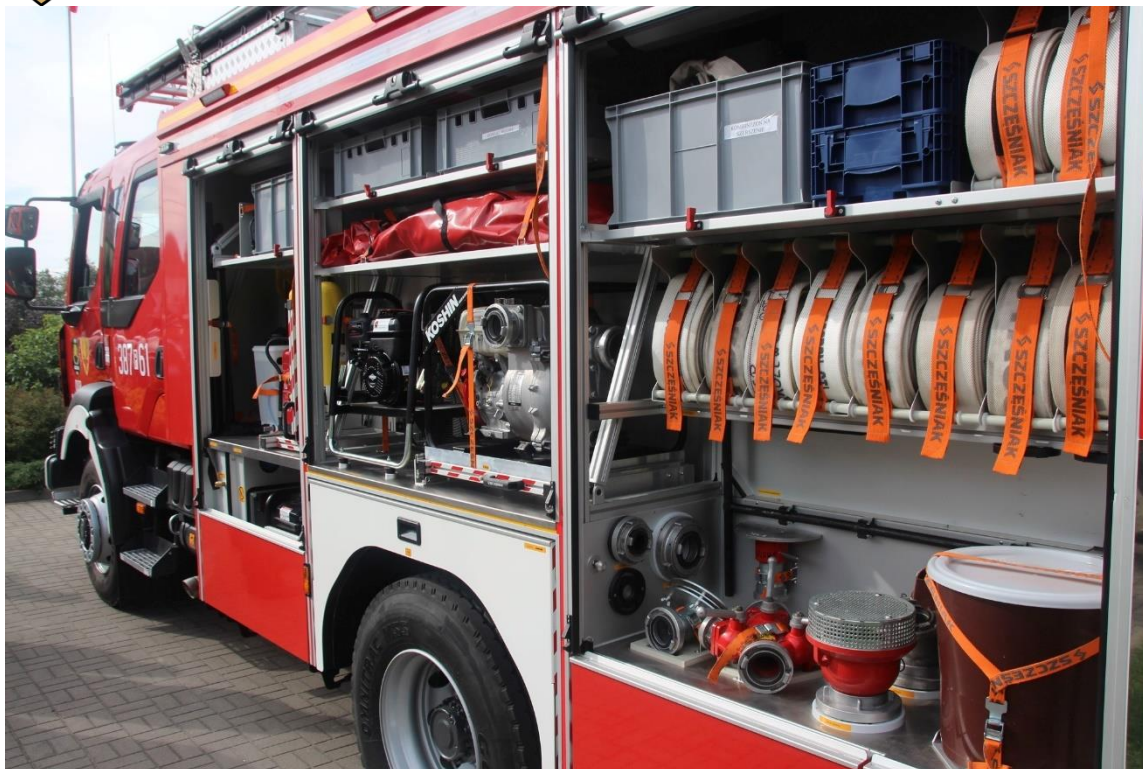
Zakup średniego samochodu ratowniczo – gaśniczego dla jednostki OSP Kąkolewo