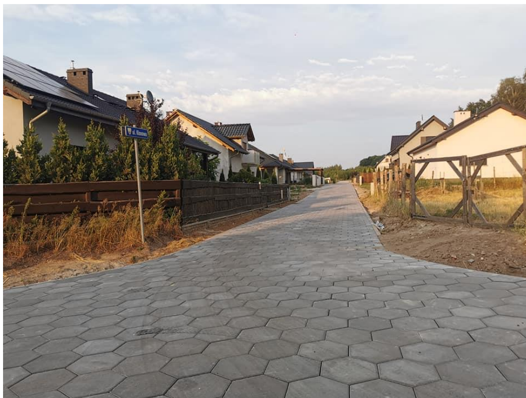
Przebudowa ulic na osiedlu „Stanisławówka” w Osiecznej