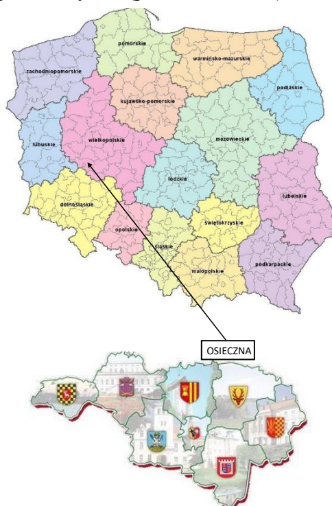
Rys. 1. Położenie gminy Osieczna

Powierzchnia całkowita Gminy wynosi 129 km 2 i jest porównywalna z większością gmin powiatu, zbliżona do prawie połowy gmin w województwie i niemalże identyczna ze średnią powierzchnią gmin w kraju. Gmina Osieczna graniczy z miastem Leszno i z pięcioma gminami: Krzemieniewo, Rydzyna, Lipno (pow. leszczyński) oraz Śmigiel i Krzywiń (pow. kościański).