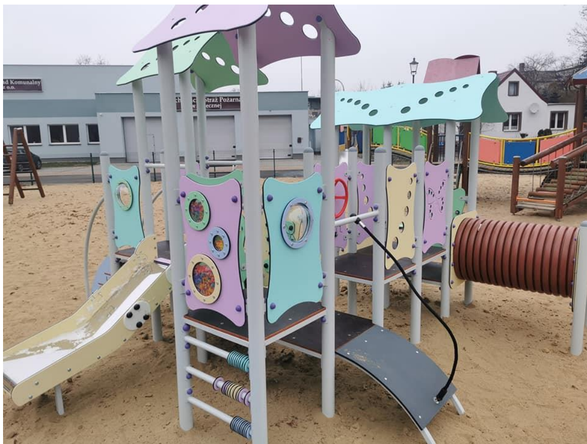
Doposażanie istniejących placów zabaw, na zdjęciu Plac 600-lecia w Osiecznej