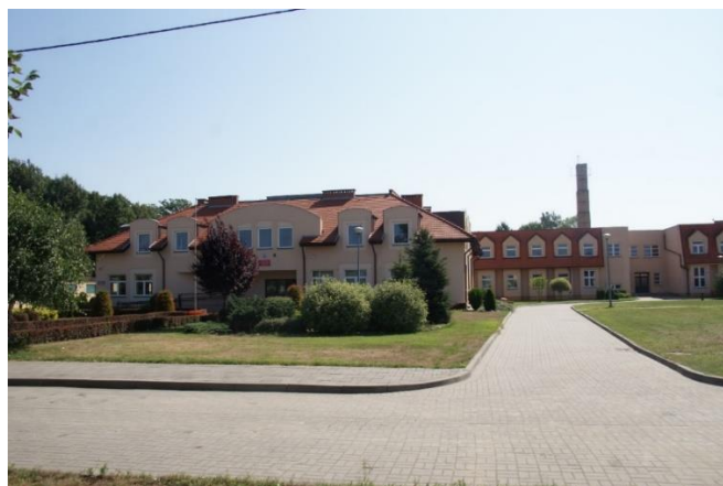
Zespół Szkół w Kąkolewie

W przeliczeniu na pełne etaty: Osieczna – 3 nauczycieli początkujących, 9 nauczycieli mianowanych i 19 nauczycieli dyplomowanych oraz w przedszkolach 2 nauczycieli początkujących, 8 nauczycieli mianowanych i 7 nauczycieli dyplomowanych. Kąkolewo – 4 nauczycieli początkujących, 5 nauczycieli mianowanych i 24 nauczycieli dyplomowanych oraz w przedszkolu 1 nauczyciel początkujący, 4 nauczycieli mianowanych i 7 nauczycieli dyplomowanych. Świerczyna - 5 nauczycieli początkujących, 7 nauczycieli mianowanych i 7 nauczycieli dyplomowanych oraz w przedszkolu 2 nauczycieli początkujących i 1 nauczyciel dyplomowany.