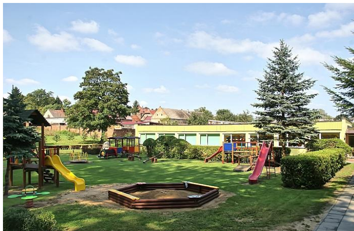
Przedszkole w Drzeczkwie

W tym roku szkoły ukończyło 137 osób, promocji do kolejnej klasy nie otrzymało 2 uczniów. W 2022 r. funkcjonowały 4 przedszkola gminne. Do gminnych przedszkoli uczęszczało 352 dzieci z roczników 2016-2020.