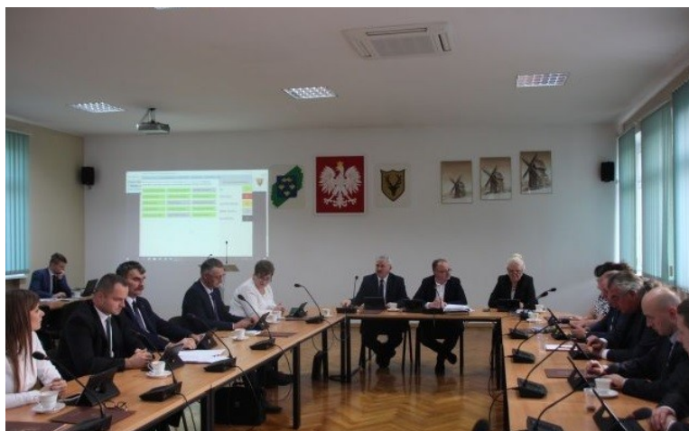
Sesja Rady Miejskiej Gminy Osieczna – zdjęcie poglądowe

Podjęte przez Radę Miejską Gminy Osieczna uchwały Burmistrz Gminy zgodnie z art. 90 ust. 1 i 2 ustawy o samorządzie gminnym (t.j. Dz. U. z 2022 poz. 559) przekazywał w nieprzekraczalnym terminie 7 dni do organów nadzoru, tj. w zakresie zgodności z prawem do Wojewody Wielkopolskiego i w zakresie spraw finansowych do Regionalnej Izby Obrachunkowej w Poznaniu. Zgodnie z art. 7 ust. 1 pkt 1 ustawy o dostępie do informacji publicznej wszystkie uchwały zostały opublikowane w Biuletynie Informacji Publicznej, natomiast uchwały stanowiące akty prawa miejscowego w Dzienniku Urzędowym Województwa Wielkopolskiego.