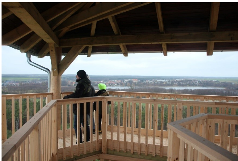
Panorama Osiecznej ze szczytu wieży widokowej „Jagoda 2”