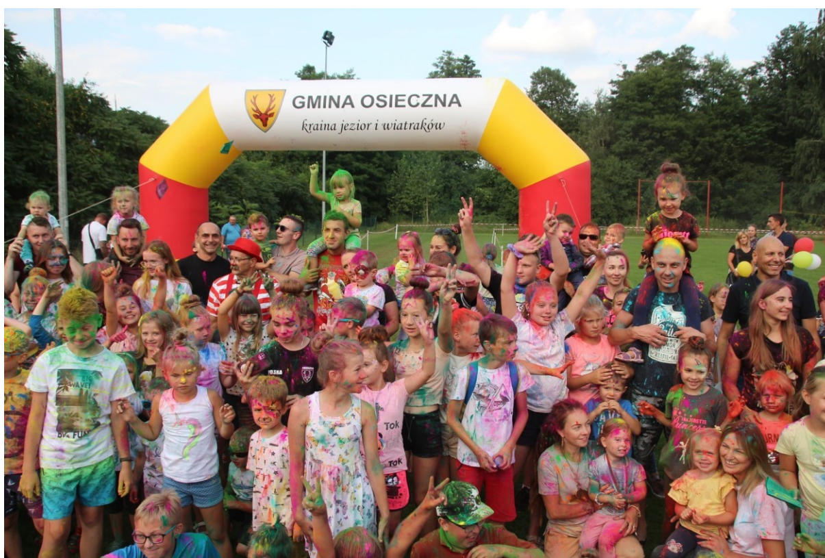
Strefa Dziecka podczas XXXIII Dni Osiecznej