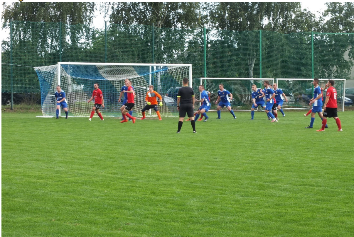
Mecz Klubu Sportowego Błękitni Kąkolewo

W ramach trybu małych dotacji wsparto wykonanie następujących zadań: