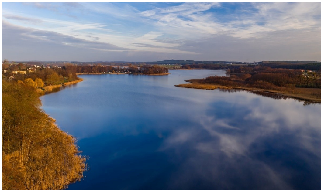
Panorama Jeziora Łoniewskiego w Gminie Osieczna

Serdecznie dziękujemy mieszkańcom, samorządowcom, przedsiębiorcom, społecznikom – każdemu, komu dobro Gminy Osieczna leży na sercu.