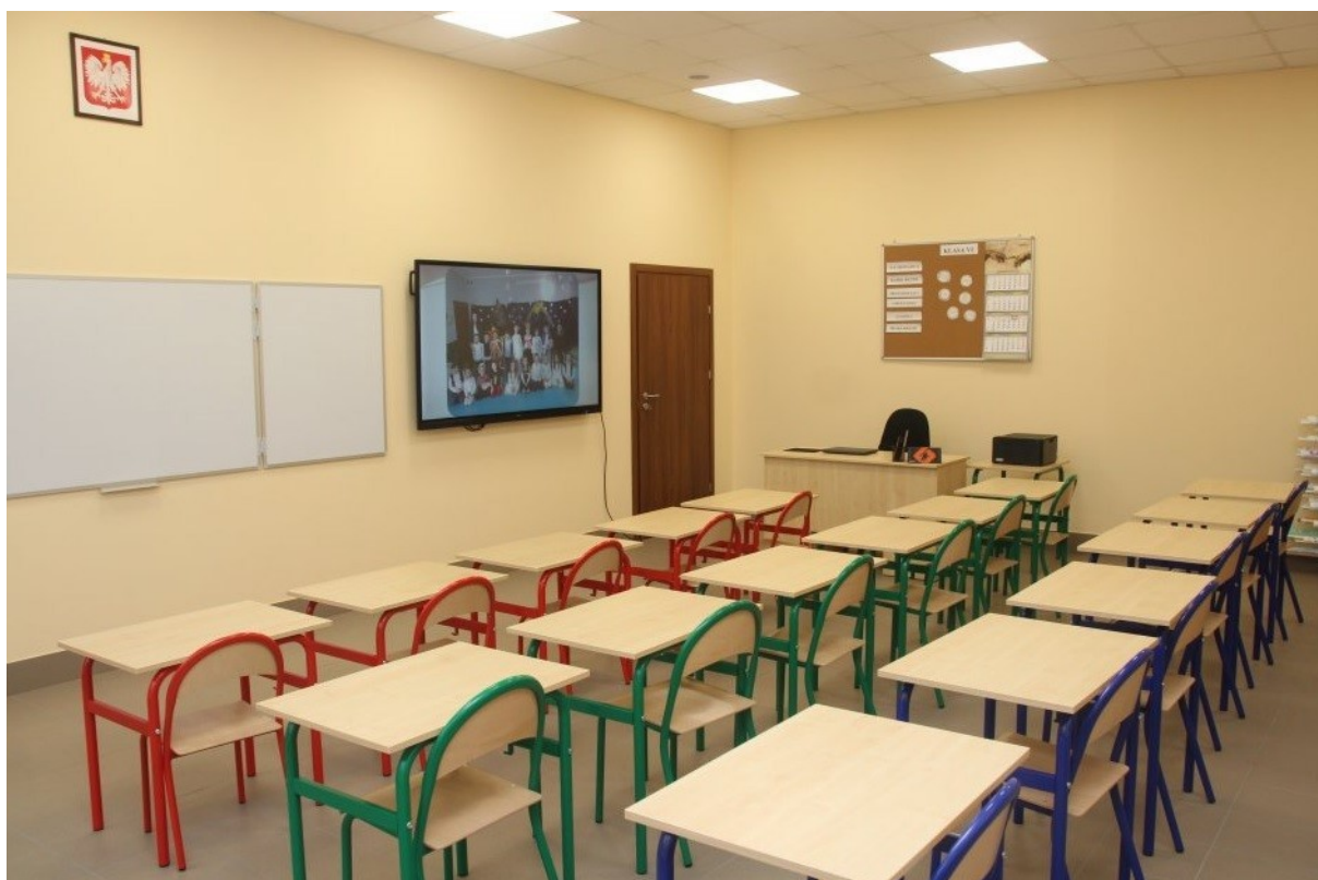
Izba lekcyjna w dobudowanej części Zespołu Szkół w Świerczynie