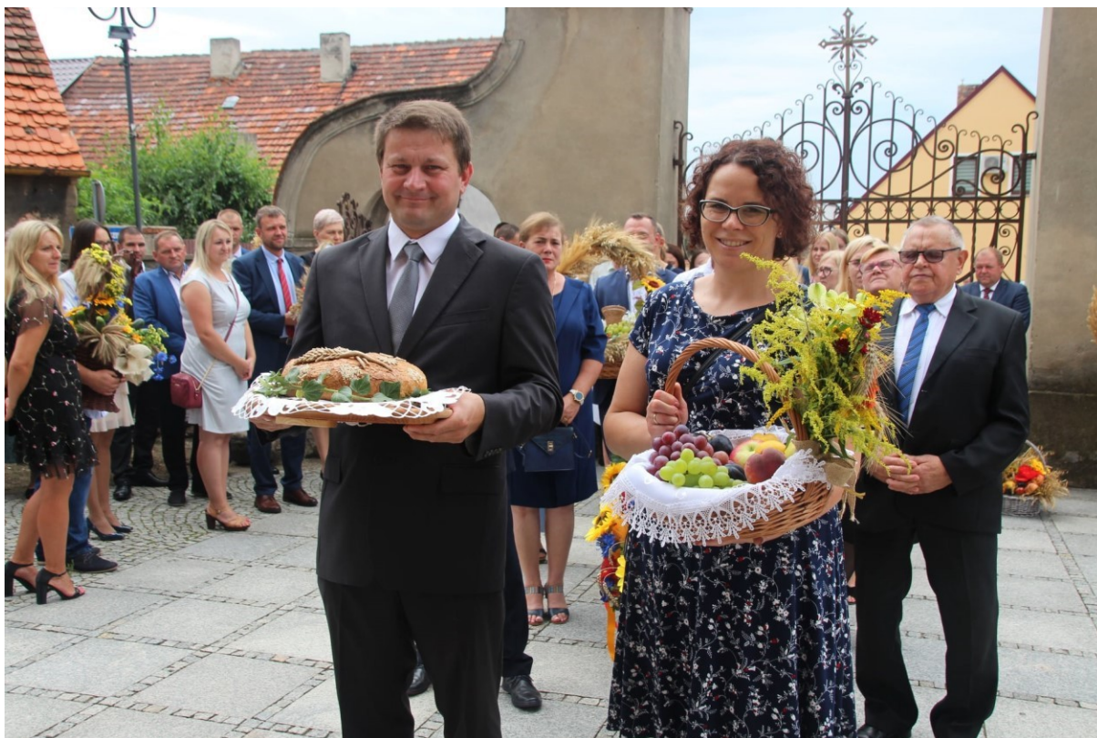
Dożynki gminne 2021

We wskazanych wydarzeniach wzięło udział ok 9000 mieszkanek i mieszkańców. Wydarzenia te wiązały się z poniesieniem kosztów w wysokości 207 121,67 zł. Przy gminnych jednostkach kultury funkcjonują następujące sekcje: