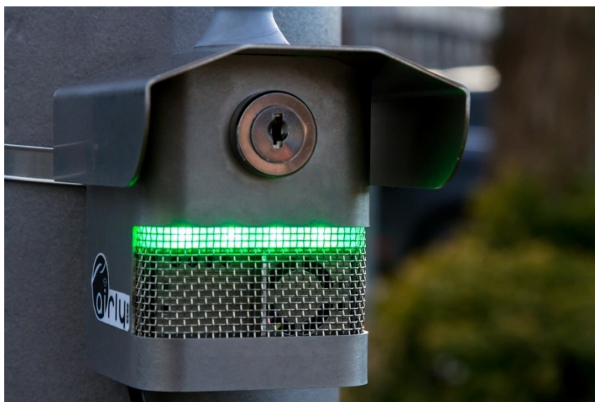
Czujnik do pomiaru jakości powietrza

Według norm jakości powietrza średnioroczny poziom dopuszczalny dla stężenia pyłów PM 10 wynosi 40 \mu\text{g}/\text{m}^3 , natomiast 24 godzinowy 50 \mu\text{g}/\text{m}^3 . Dla PM 2,5 średnioroczny wynosi 20 \mu\text{g}/\text{m}^3 .