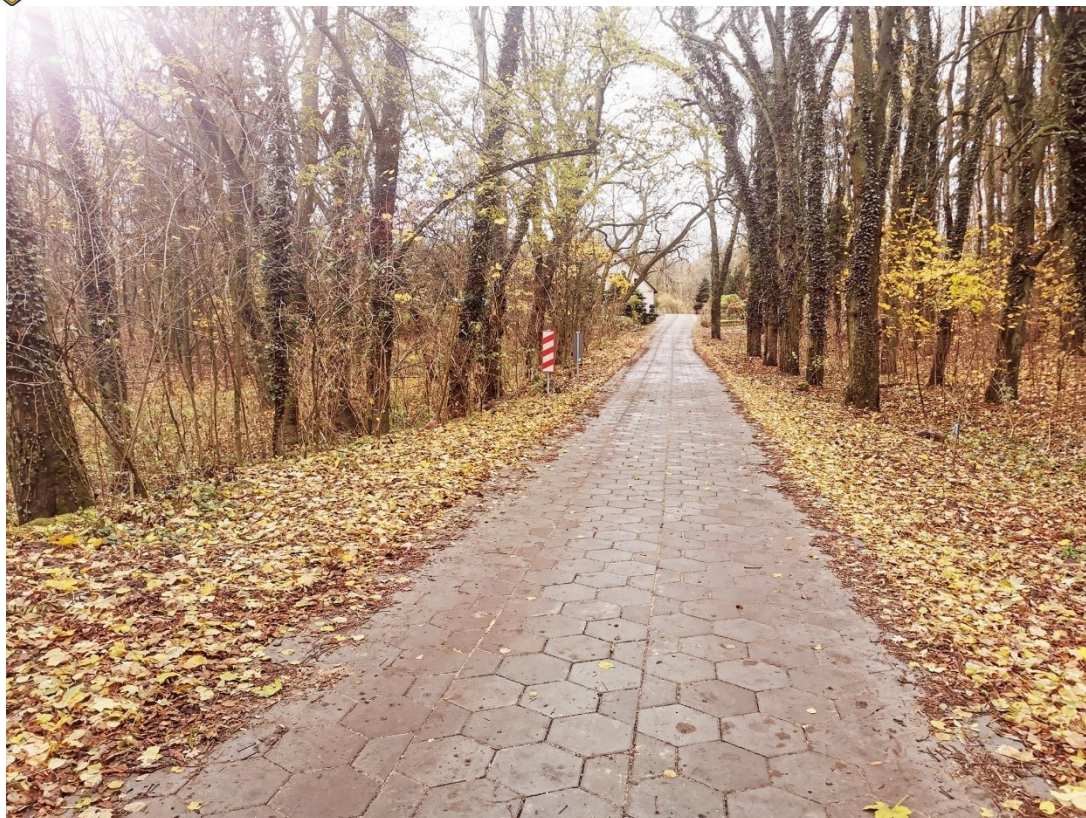
Przebudowana droga gminna w Witostawiu