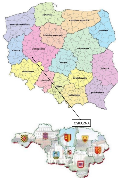
Położenie Gminy Osieczna

Powierzchnia całkowita Gminy wynosi 129 km 2 i jest porównywalna z większością gmin powiatu, zbliżona do prawie połowy gmin w województwie i niemalże identyczna ze średnią powierzchnią gmin w kraju. Gmina Osieczna graniczy z miastem Leszno i z pięcioma gminami: Krzemieniewo, Rydzyna, Lipno (pow. leszczyński) oraz Śmigiel i Krzywiń (pow. kościański).