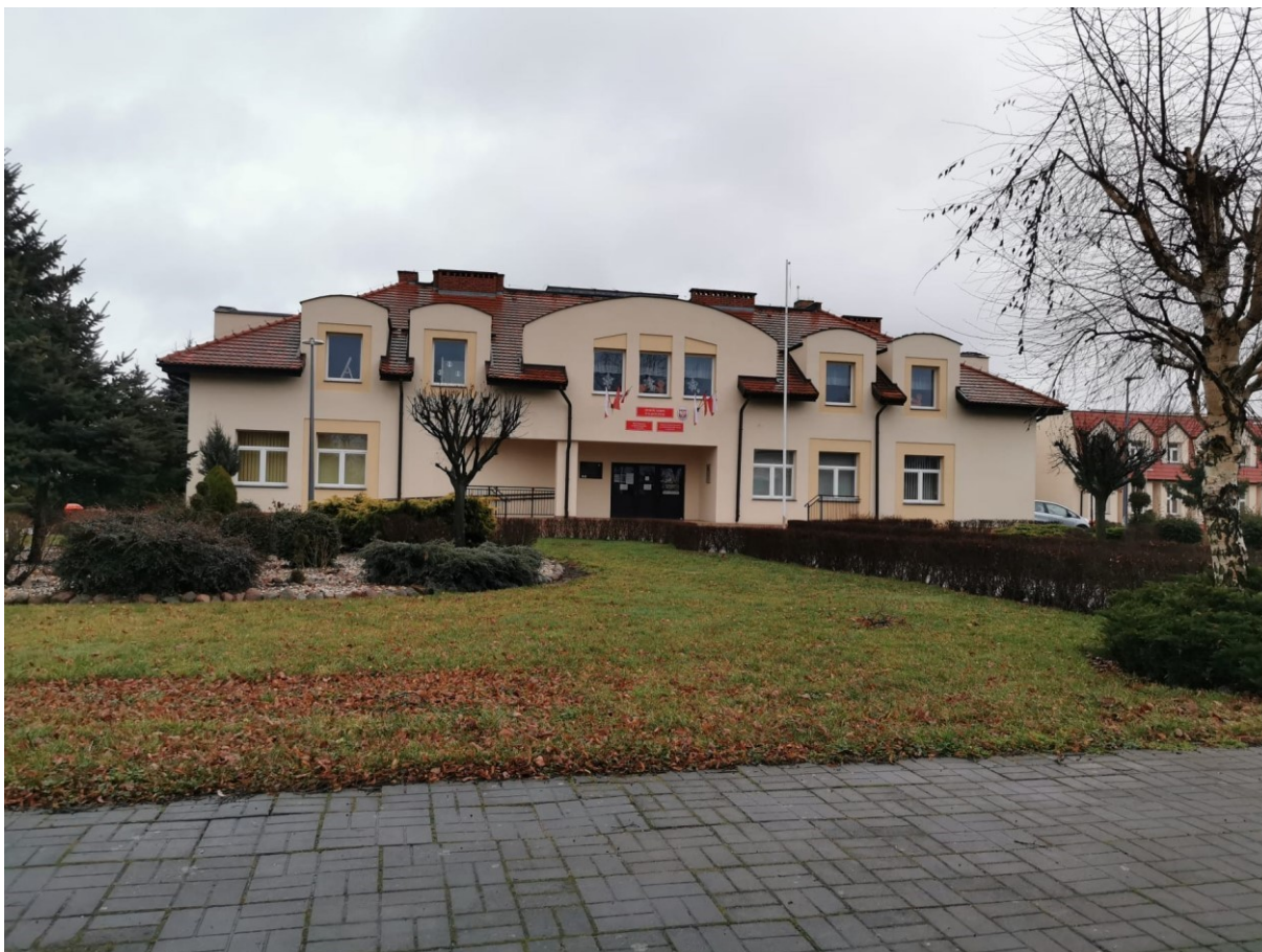
Budynek Zespołu Szkół w Kąkolewie

Świerczyna - 4 nauczycieli kontraktowych, 7 nauczycieli mianowanych i 9 nauczycieli dyplomowanych oraz w przedszkolu 2 nauczycieli stażystów, 1 nauczyciel kontraktowy i 1 nauczyciel dyplomowany.