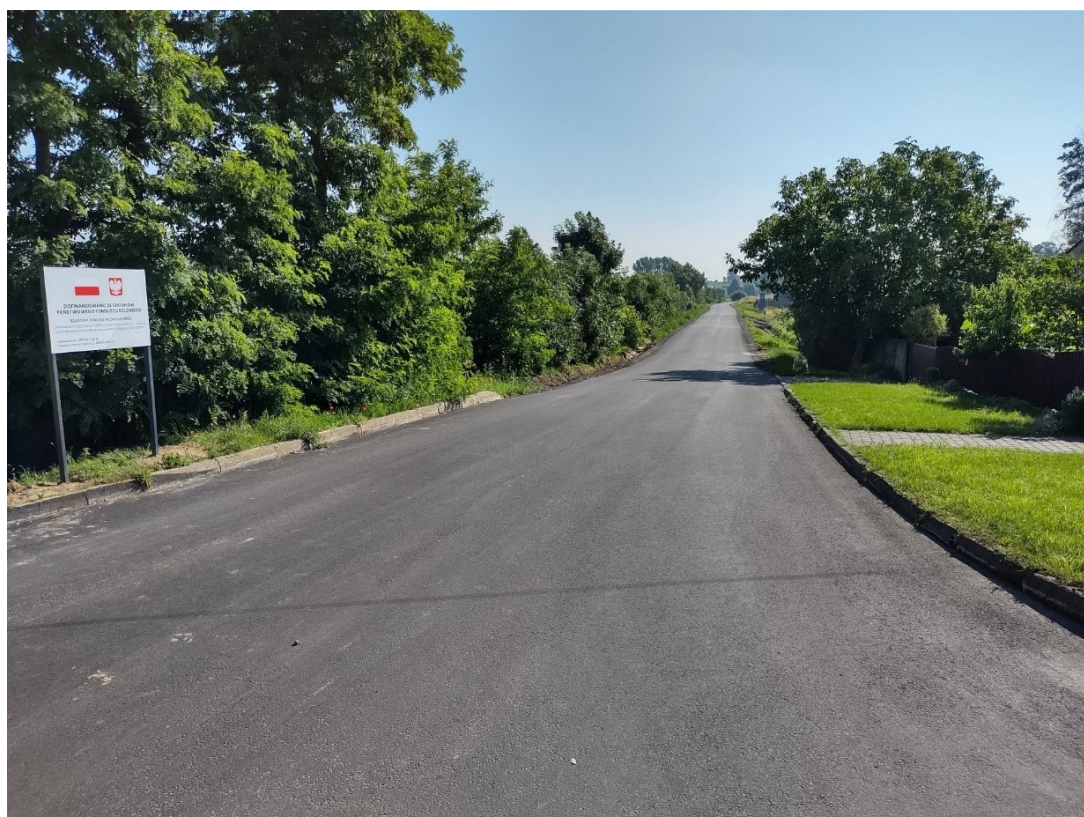
Przebudowana droga gminna w Ziemnicach