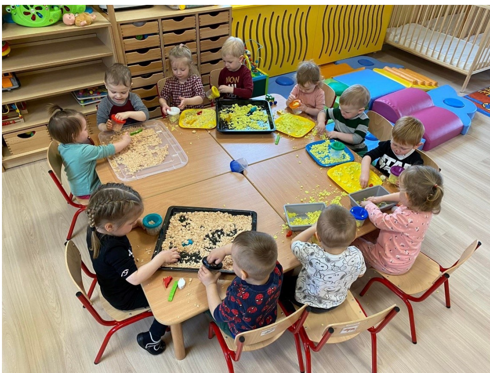
Dzieci w żłobku w Osiecznej podczas zajęć sensorycznych

Z początkiem 2021 roku rozpoczęły w naszej gminie działalność dwa żłobki – w Osiecznej i w Kąkolewie. Każdy z tych żłobków może przyjąć 16 dzieci w wieku od 1. roku życia do 3 lat. Zainteresowanie wśród rodziców małych dzieci jest bardzo duże. Żłobki zostały zbudowane i wyposażone dzięki wsparciu funduszy unijnych i to wsparcie obejmuje także funkcjonowanie placówek do września 2022 roku.