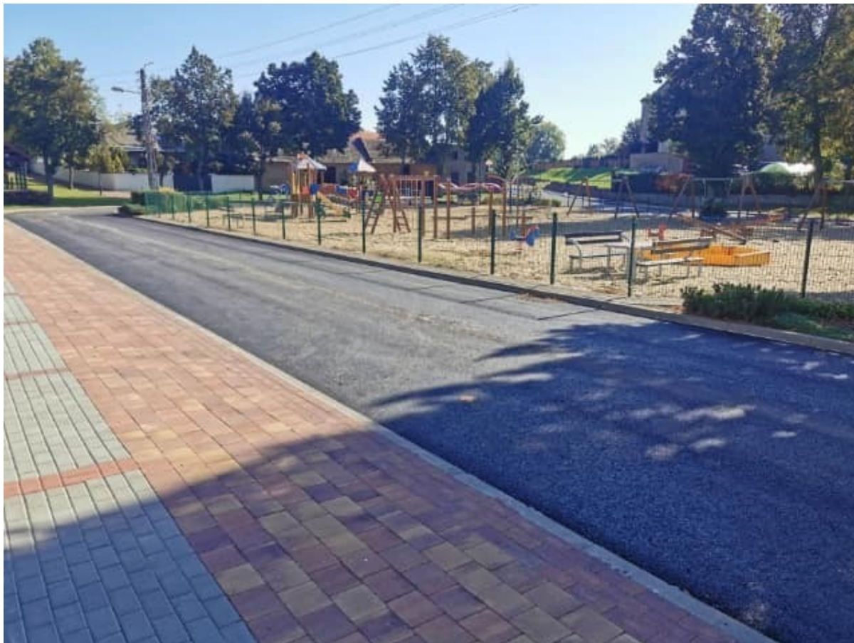
Plac 600-lecia w Osiecznej po rewitalizacji