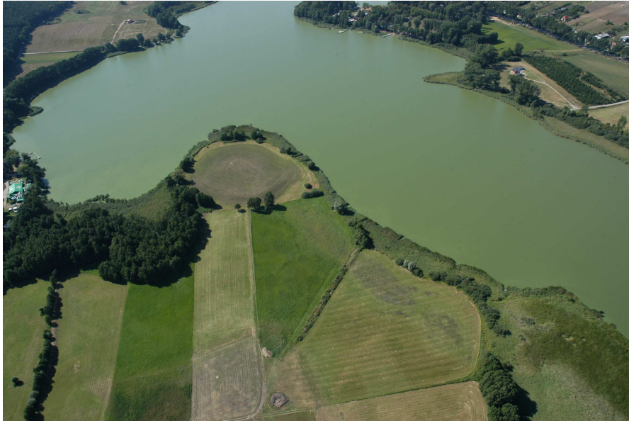
Zdjęcie lotnicze terenu grodziska